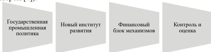
Рис. 1. Место института развития в реализации промышленной политики

Перспективным подходом к созданию промышленной политики может выступить новая система институтов развития, которая обеспечит, в интересах государства, достижение ключевых показателей экономического роста, снизит объем и сроки согласования, а также количество проверок контролирующими органами (рис. 1. – сост. автором [4]).